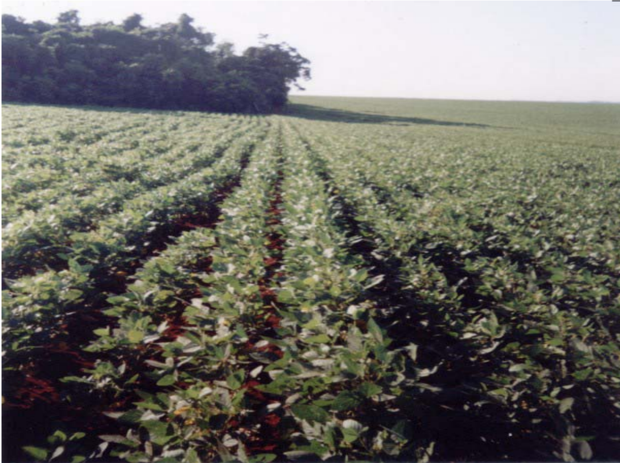
SOJA ORGÂNICA – RIO GRANDE DO SUL

fone/fax: 48-232.80.33 e.mail: ecocert@ecocert.com.br florianópolis-sc